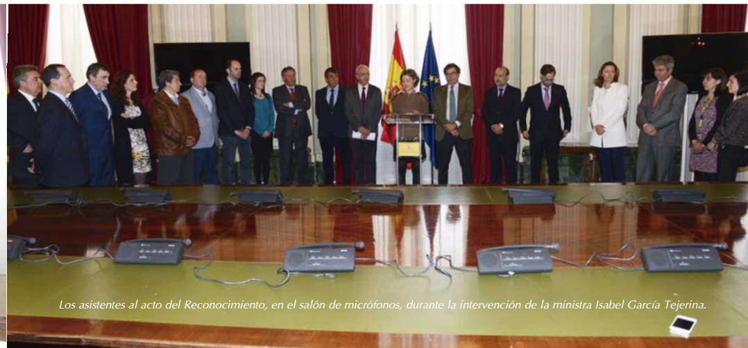
Los asistentes al acto del Reconocimiento, en el salón de micrófonos, durante la intervención de la ministra Isabel García Tejerina.

los marca para la EAP es porque consideramos importante que contribuya a la mejora de la renta de los productores agrarios que integra, contribuyendo con ello a la sostenibilidad de la actividad agroalimentaria, al mantenimiento del medio rural y al equilibrio territorial. No se olvida, tam-