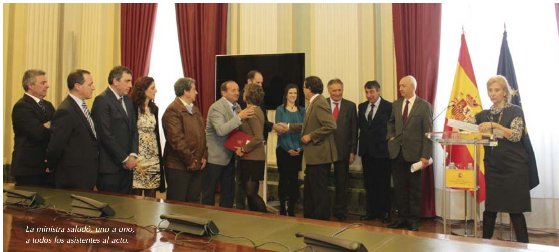
La ministra saludó, uno a uno, a todos los asistentes al acto.