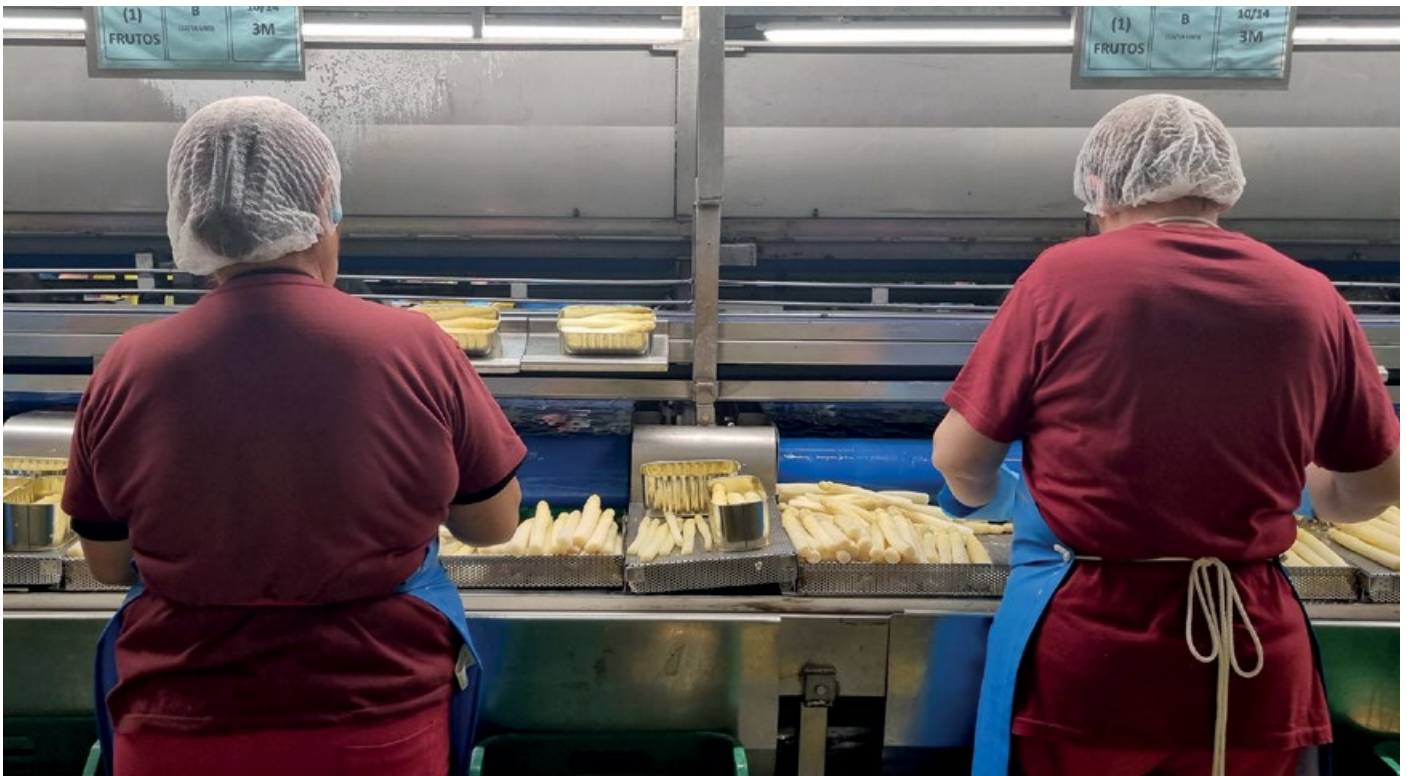
Varias trabajadoras envasando espárrago en la fábrica de Dantza en Andosilla