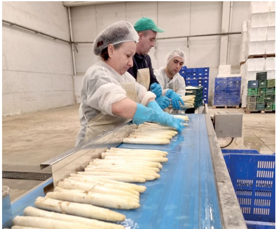
En el CHC comenzaron con la confección el 7 de abril

Cuando el espárrago va a ser trabajado, normalmente el mismo día o el siguiente, se baña en agua nuevamente y se corta para sanear. Posteriormente pasa a la calibradora, donde se detecta el diámetro, y en función del calibre se distribuye por las diferentes cintas clasificadoras de la línea para ir confeccionando los distintos formatos que se elaboran