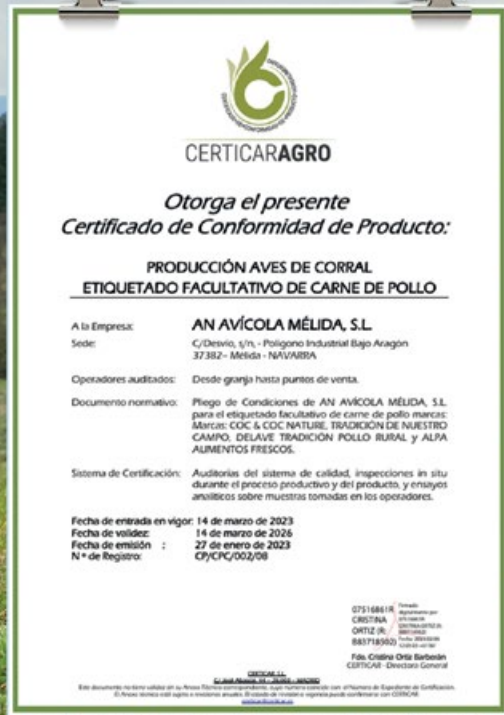
Certificado de conformidad de producto Campero renovado recientemente

y baños de arena que contribuyen a reducir el estrés y mejorar la salud general de las aves.