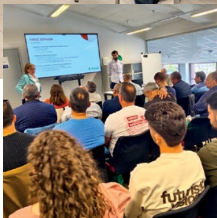
Ponencia sobre el funcionamiento de las cooperativas