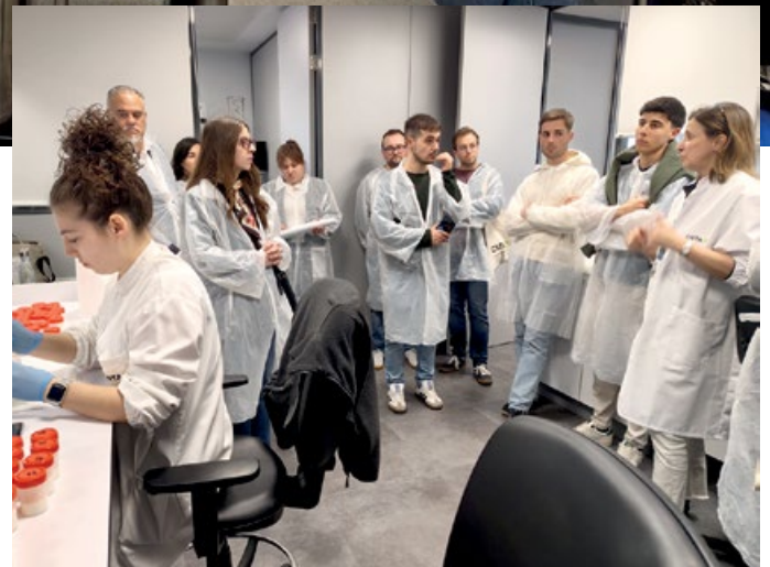
Las dinámicas interactivas permitieron intercambiar conocimientos y experiencias