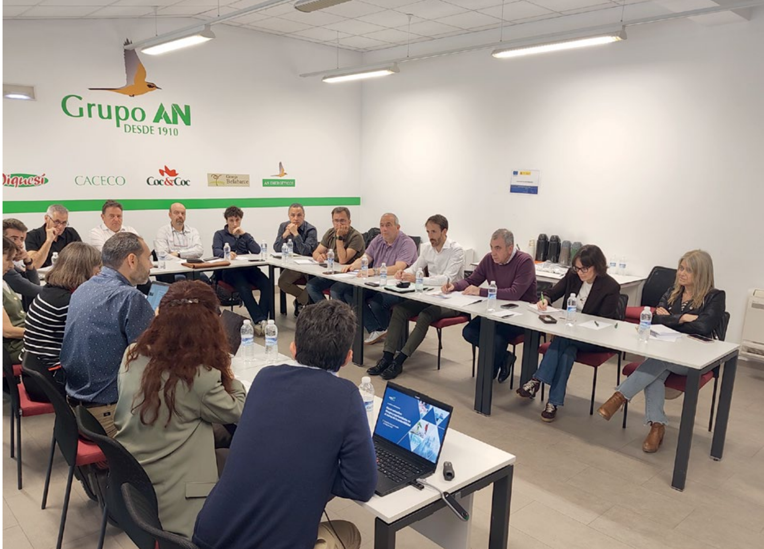
Imagen de los asistentes a la jornada de formación en sostenibilidad

la diligencia debida o la legislación en materia de envases, además de repasar los principales avances regulatorios impulsados desde el ámbito comunitario.