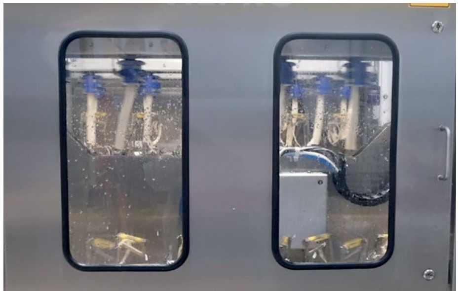
Una de las novedades de Dantza para esta campaña es una nueva peladora

El espárrago que se recibe se pesa, se identifica, se toma una prueba para realizar el muestreo de calidad y se guarda en una cámara, donde se intenta que esté el menor tiempo posible hasta el momento de ser trabajado. El primer paso es atemperarlo en el hidratador, para que esté en mejores condiciones para su manipulación. Posteriormente se coloca en la cinta y se distribuye entre las distintas peladoras, programadas para que corten los distintos calibres.