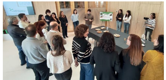
La jornada de cierre concluyó con la cata de los productos desarrollados a lo largo del proyecto

Hidropep, liderado por el Grupo AN, ha contado con la colaboración de Nagrifood y la participación de Alimentos Sanygran, Monbake, Nucaps Nanotechnology, El Caserío de Tafalla, el Centro Nacional de Tecnología y Seguridad Alimentaria (CNTA) y la Universidad de Navarra. El proyecto se ha desarrollado dentro de la convocatoria de proyectos estratégicos de I+D 2023, en el Reto Alpes de alimentación personalizada y sostenible, y ha contado con financiación del Gobierno de Navarra y del Fondo Europeo de Desarrollo Regional (FEDER).