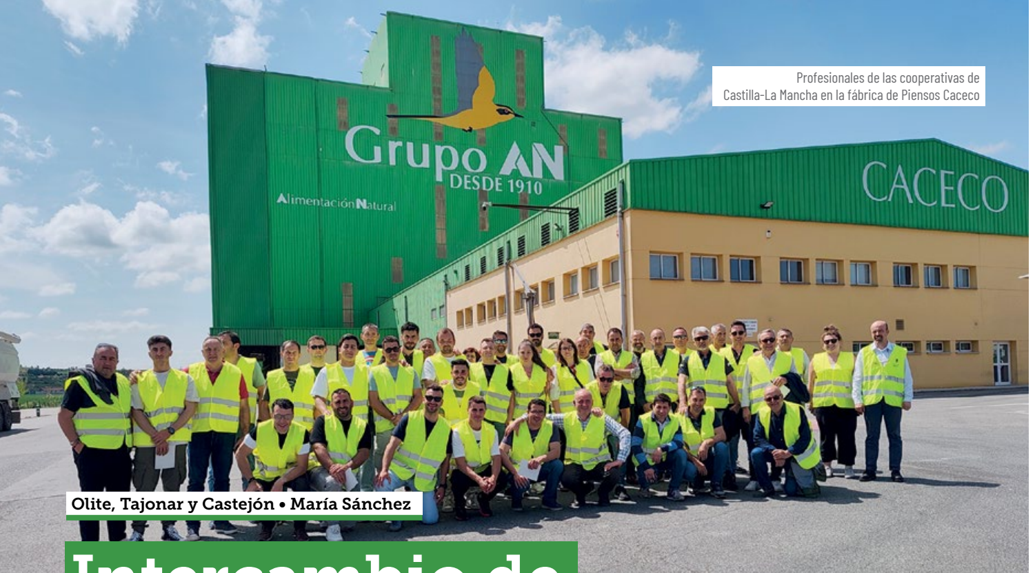
Olite, Tajonar y Castejón