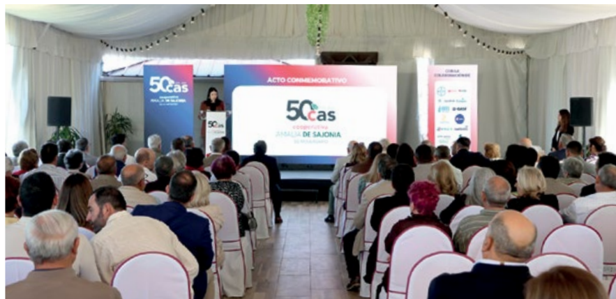
La cooperativa Amalia de Sajonia celebró su 50 aniversario el sábado 28 de marzo