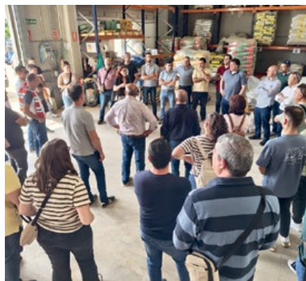
Los asistentes en las instalaciones de Olite

La actividad comenzó en la localidad navarra de Olite, donde los asistentes pudieron conocer el