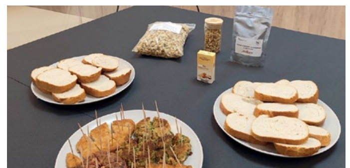
Varios de los productos derivados de proteína vegetal que se pudieron degustar

Puedes ver el vídeo resumen del proyecto Hidropep leyendo este código QR