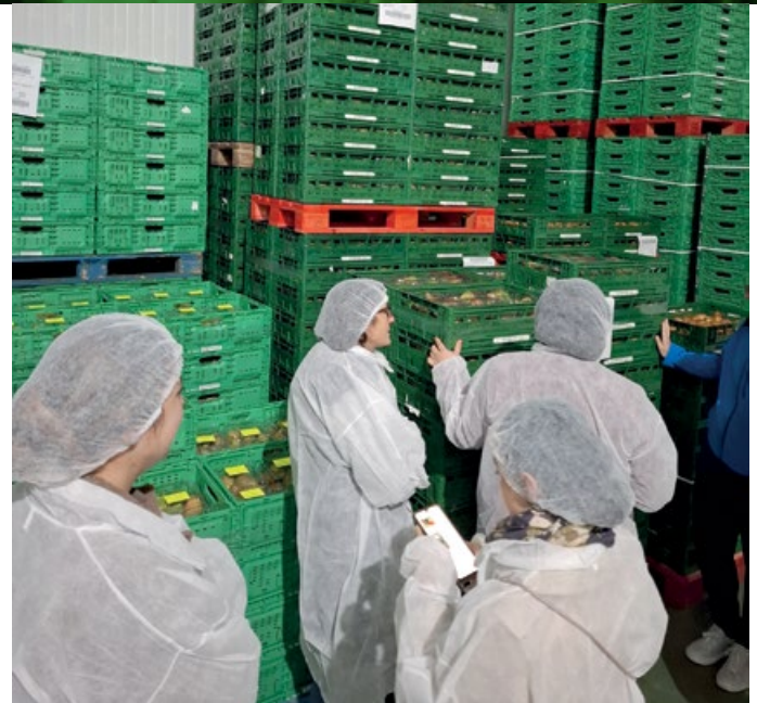
Representantes de distintos socios de Alimpack han visitado en los últimos meses el Centro de Procesamiento Avícola de Mérida y el Centro Hortofrutícola de Tudela

peras, brócoli y acelga. A finales de octubre se realizó una primera visita al Centro Hortofrutícola de Tudela con un objetivo similar al de la visita a Mérida. En ella, se presentaron los envases que utiliza la sección y se valoró la posibilidad de trabajar con cinco de ellos en este proyecto. Recientemente, se ha mantenido una reunión con Solidus en la que han presentado los modelos de envases desarrollados, con el fin de evaluar su viabilidad técnica.