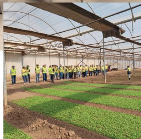
Visita a los invernaderos en Castejón