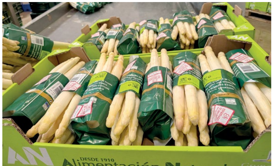
El formato de manojos es el que mueve más kilos comercializados

"Al principio producimos prácticamente todo el espárrago para fresco, hasta que comienzan las