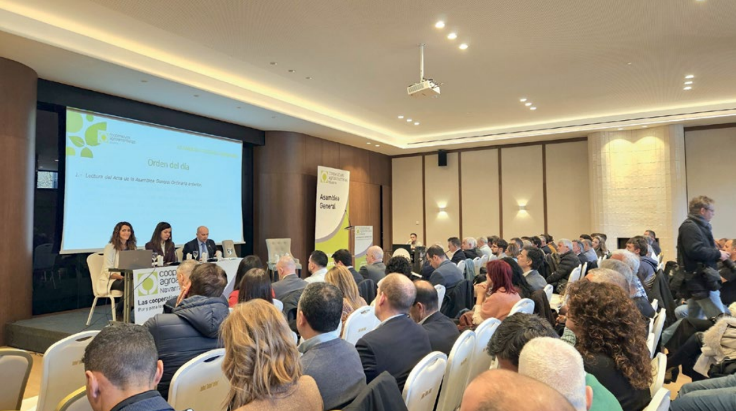
Más de un centenar de personas acudieron a la asamblea de UCAN

que "es momento de fortalecer las alianzas con un sector que representa el 6,5 % del PIB de Navarra y que está perfectamente consolidado".