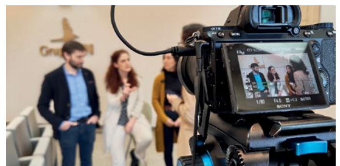
Grabación del vídeo explicativo del trabajo de los socios durante estos tres años