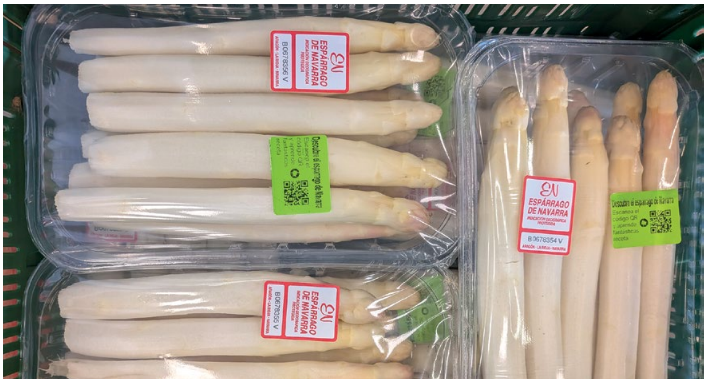
Gracias a las bandejas termoselladas el espárrago fresco se mantiene en buenas condiciones alrededor de 15 días