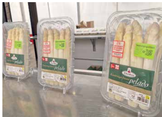
También se sortearon varios lotes de espárrago fresco pelado de la marca Dantza