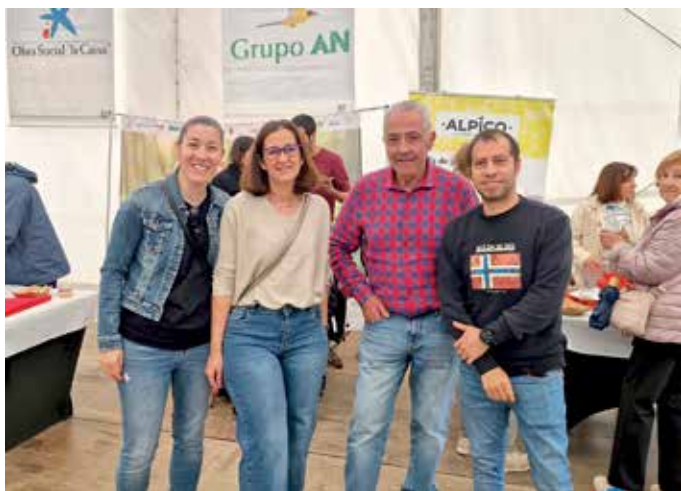
Al evento acudieron representantes del Grupo AN