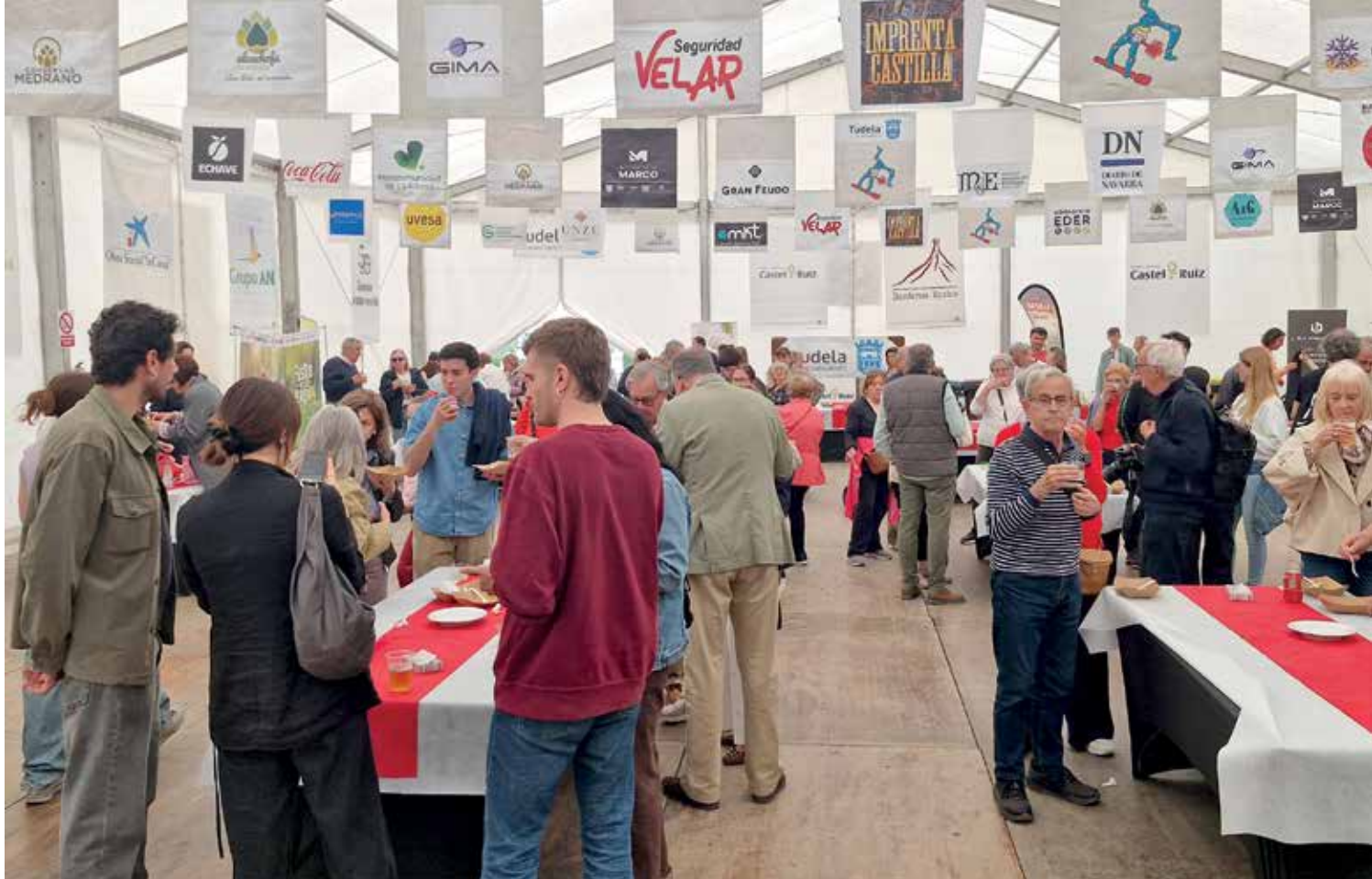
Cerca de 500 personas disfrutaron de espárragos frescos con vinagreta casera