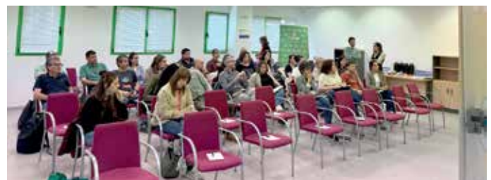
Asistentes a una de las jornadas formativas celebradas en Olite

Las formaciones se estructuraron en distintas ponencias, que giraron en torno a temas como el análisis del marco normativo en sostenibilidad y descarbonización, en donde se profundizó sobre la gestión del desperdicio alimentario, el consumo sostenible y la eficiencia energética; y la mitigación y adaptación al cambio climático, con la huella de carbono o el plan de movilidad sostenible como ejes centrales, así como la importancia de comunicar de manera correcta la sostenibilidad teniendo siempre presente la normativa de greenwashing .