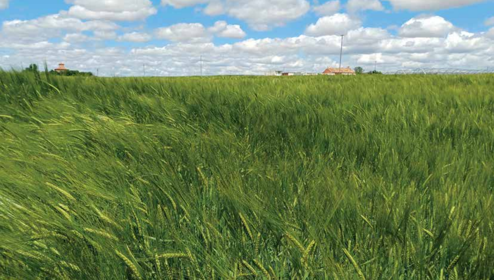
Campo de cebada en la zona de Medina del Campo, Valladolid, a mediados de mes

Echando la vista atrás, la campaña de cereales 2026 ha estado marcada especialmente por un invierno que la Agencia Estatal de Meteorología (AEMET) describió como “muy cálido en cuanto a temperaturas y muy húmedo en lo que a precipitaciones se refiere”. Estas precipitaciones, que fueron claramente superiores al promedio normal en la mayor parte del país, fueron el denominador común en las diferentes zonas donde opera el Grupo AN y también han sido el fenómeno atmosférico más comentado en el informe de Cooperativas Agro-alimentarias de España. En este sentido, la organización destaca que “las abundantes precipitaciones registradas durante la siembra dificultaron las labores en algunas zonas productoras y, posteriormente, las altas temperaturas y la irregularidad de las lluvias en fases avanzadas del ciclo han afectado de manera desigual a los cultivos en las principales regiones cerealistas”.