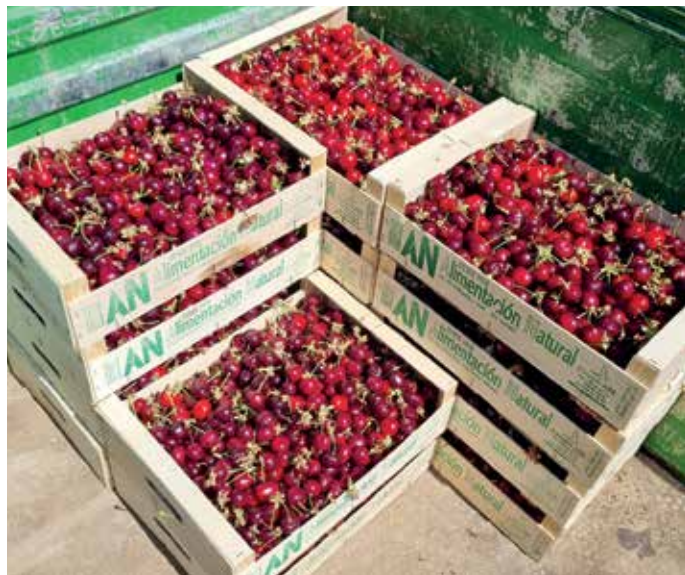
Las cerezas de Etxauri tienen un color brillante e intenso

El mejor momento de esta fruta llega escalonadamente durante la campaña. Para la recogida, los recolectores se atan las cestas a la cintura y cogen las cerezas a dos manos, una a una por el mango y con mucha delicadeza,