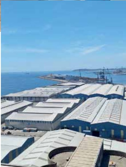
El puerto de Tarragona es el puerto cerealista más grande de España