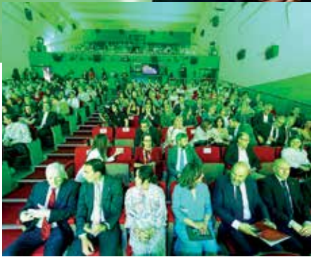
Más de 400 personas acudieron a la ceremonia de entrega en el Auditorio Municipal Emiliano Allende de Medina del Campo