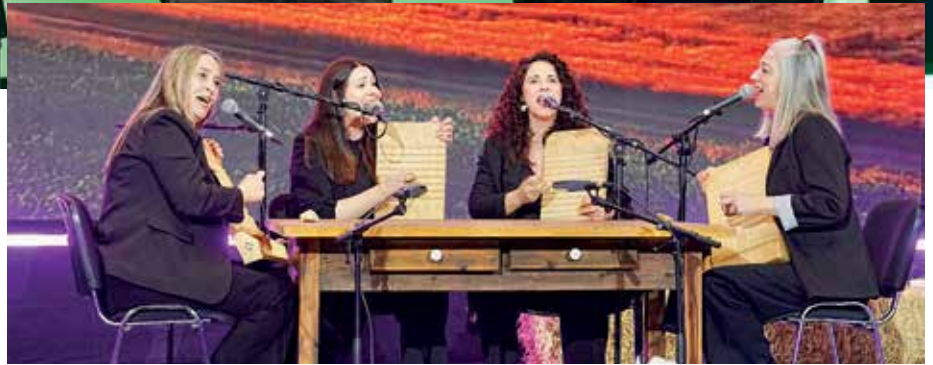
La gala comenzó con una actuación de Murmurare, grupo de folk segoviano formado por cuatro músicas que utilizan elementos de percusión inusuales como piedras y tablas de lavar para acompañar su repertorio de música tradicional