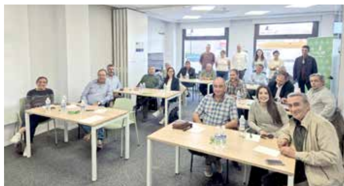
La jornada estuvo dirigida a productores del sector primario y responsables de cooperativas de Castilla y León

La jornada se desarrolló en torno a tres bloques formativos: el entorno social de las cooperativas, en el que se profundizó sobre asociacionismo y jóvenes y mujeres en el sector agroalimentario; las competencias profesionales, donde se habló de la planificación, las cadenas de valor y la innovación; y habilidades de liderazgo, en el que se dieron claves para la creación de redes, el análisis de riesgos y la competitividad. Como se puso de manifiesto, es fundamental crear redes para abordar algunos retos a los que se enfrenta el sector agroalimentario, como el escaso relevo generacional o los desafíos demográficos.