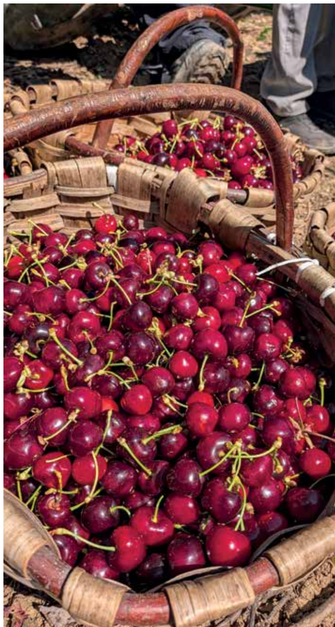
Las cerezas se almacenan en recipientes de pequeño tamaño para evitar daños por aplastamiento

Todas las cerezas se comercializan en fresco, y principalmente se trabaja para los mercados de San Sebastián, Zaragoza y Madrid. Cuando hay gran cantidad, a media-