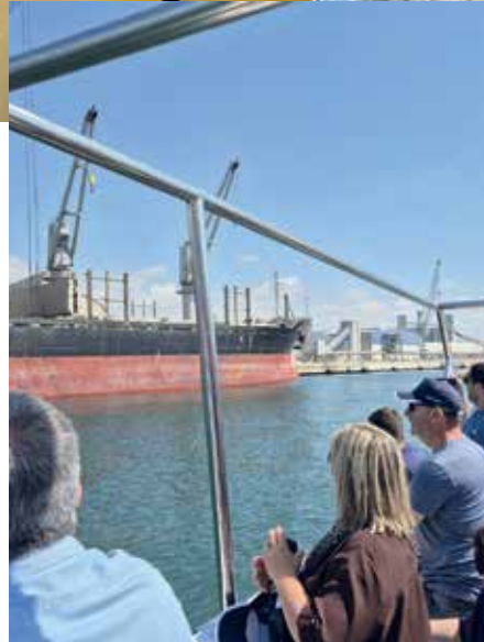
Los visitantes, durante el recorrido en barco por las instalaciones