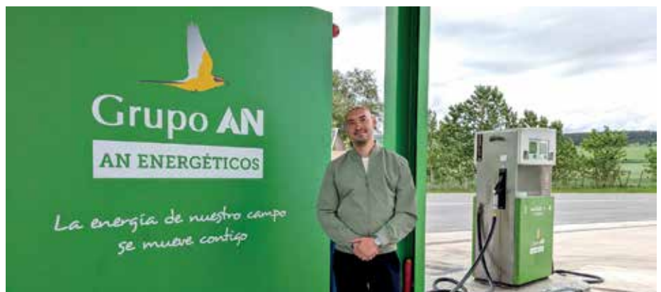
Matarredona, en la gasolinera de la sede central del Grupo AN en Tajonar

De su experiencia durante estos años, destaca que "Energéticos permitió abrir puertas y negocios en Aragón: para una cooperativa, una gasolinera es importante, porque le