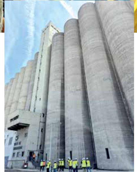
Silo cerealista dentro de las instalaciones del puerto de Tarragona

Grupo AN, promovió esta iniciativa que refuerza una visión más global de los mercados: "Es una experiencia muy buena, porque acercamos a nuestros socios cooperativistas a ver la realidad de la otra forma de abastecimiento del país, que es la importación. Es positivo que podamos ver in situ la realidad de la llegada de los barcos de 60.000 toneladas de Ucrania y de otros lugares, que son quienes nos hacen la competencia y marcan por tanto los precios finales de los cereales nacionales, ya que no solo nosotros producimos cereal. Hay que estar mirando al puerto siempre y ver lo que viene de fuera, para saber por qué los mercados se mueven como se mueven, ya que están muy globalizados. Para que nos hagamos una idea de la magnitud de este puerto, todos los años por Tarragona